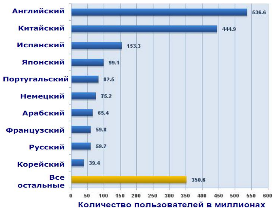
Рис. 1 Десятка наиболее популярных языков интернета среди 1 966 514 816 пользователей на 30 июня 2010г. (1)

Притом, что количество русскоязычных пользователей интернета в десять раз меньше англоязычных (диаграмма на рисунке 1), получается, что в англоязычном мире интерес к тепловым насосам примерно в двенадцать раз выше, чем в русскоязычном.